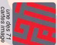
une des 71 cartes image